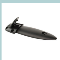
Fixations pour jonction de bureaux